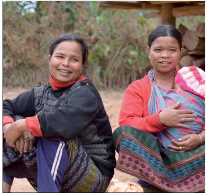
Jonge moeders in A Tuc, gemeente Huong Hoa

die vaak analfabeet zijn, door veel gebruik te maken van zang en schaduwspel. Wat zou het geweldig zijn als we de andere groepen in dat gebied ook op weg kunnen helpen naar een zelfstandige toekomst, met kansen op een goed bestaan.”