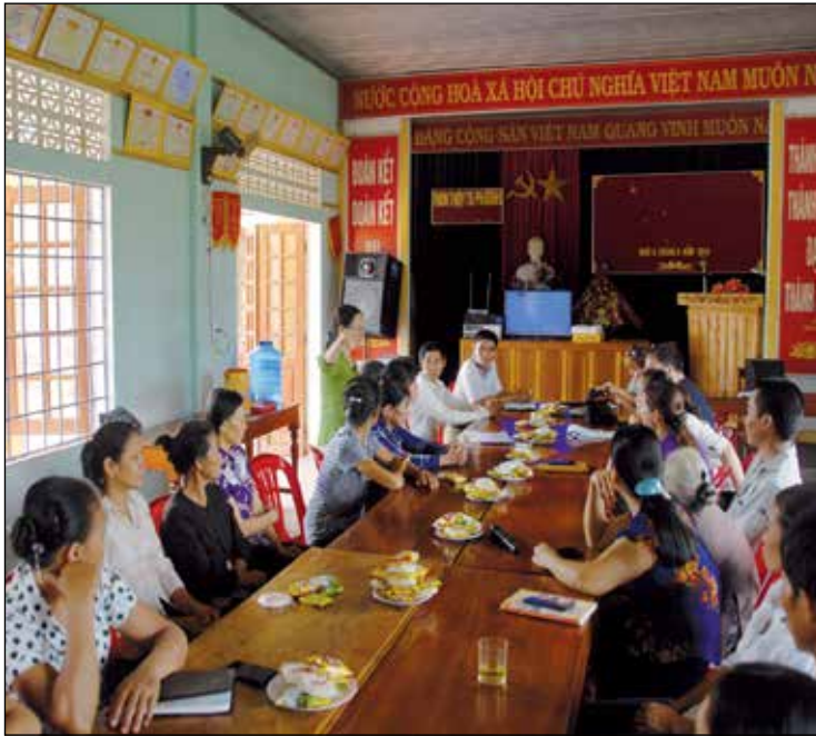
Bijeenkomst zelfhulpgroep psychisch zieken en hun families in Vinh Linh