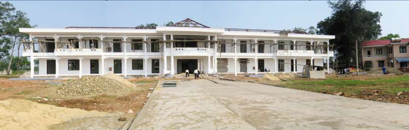
bouw Hogere Medische School, rechts MCNV kantoor Dong Ha

Ik ben blij u te vertellen dat de Hogere Medische School (SMS) begin februari de universitaire status van ‘Medisch College’ heeft gekregen. Dat is een bijzondere waardering voor de provincie Quang Tri, maar ook voor ons allen hier op kantoor in Dong Ha en zeker ook voor u als onze donateurs!