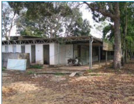
deel van het oude Holland ziekenhuis