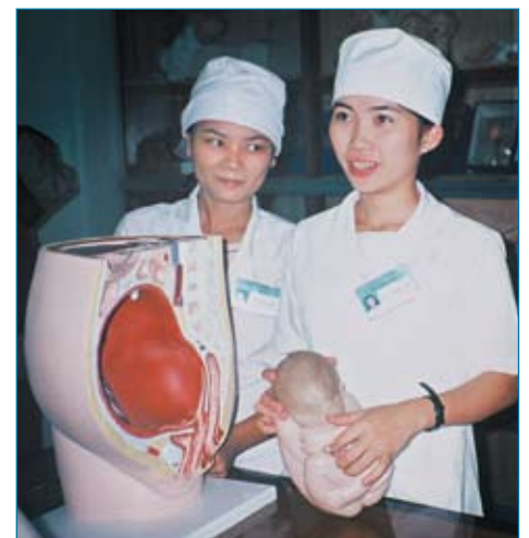
vroedvrouwen in opleiding