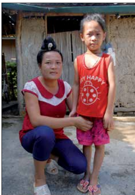
Van met haar dochter

politieke functie, dat is niet makkelijk. Je moet vechten tegen vooroordelen en tradities. Ik kon dankzij MCNV-workshops meedoen aan de verkiezingen voor het districtsbestuur van Ben Tre en ik ben samen met twee andere vrouwen gekozen. Nu kan ik me écht gaan inzetten voor vrouwenzaken. MCNV helpt me met trainingen om dit werk te kunnen doen.”