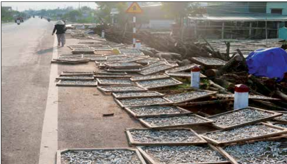
Voor de ramp: volop vis in de kustdorpen

De staalfabrikant heeft inmiddels toegegeven verantwoordelijk te zijn en heeft 500 miljoen dollar aan hulp toegezegd. Vanaf november keren ze alle getroffen huishoudens een bedrag van zes maandlonen uit. Dat lijkt veel, maar de vissers zullen dit geld direct moeten uitgeven omdat hun schulden inmiddels hoog zijn opgelopen. MCNV zoekt momenteel naar sponsors en partnerschappen in het bedrijfsleven in Vietnam en Nederland om met de voorgestelde verbeteringen te kunnen starten. ◀