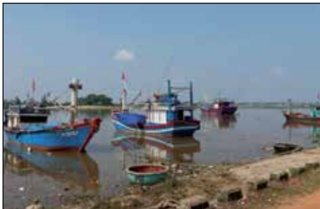
Vissersboten noodgedwongen voor anker door milieuramp

In april van dit jaar werden vijf dorpen aan de kust van de provincie Quang Tri getroffen door een milieuramp: het zee-water werd ernstig vervuild door lozingen van een in Vietnam gevestigde Taiwanese staalfabriek waardoor in de kustwateren massale vissterfte ontstond. In de getroffen dorpen werkt bijna iedereen in de visserij of in de verwerking of handel van schaal- en schelpdieren. De vissers raakten door de milieuramp vrijwel direct hun inkomsten kwijt en de markt voor seafood stortte in. De provinciale regering kwam met rijst, geld en een noodplan en vroeg MCNV om advies vanwege haar expertise en ervaring met levensonderhoud programma's en duurzame oplossingen.