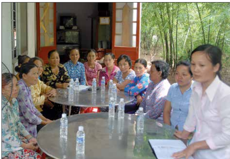
Bijeenkomst van de microkredietgroep van Yen (5 e van links)

Overall in Vietnam zijn vrouwen hard aan het werk, op de rijstvelden, in winkeltjes en restaurantjes, maar ook straten vegen in Hanoi en Ho Chi Minhstad in het holst van de nacht. Als echte werkbijen houden deze vrouwen alle ballen tegelijk in de lucht, maar wat als er een kink in de kabel komt?