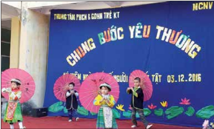
Optreden van gehandicapte kinderen in Cao Bang