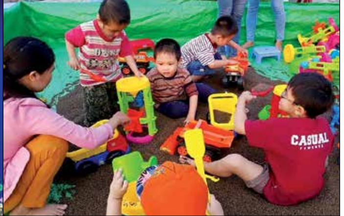
MCNV organiseert buitenschoolse activiteiten voor gehandicapte kinderen

en oma te herkennen en de bijpassende woorden me, bó en bà uit te spreken. De ouders worden daarna begeleid om de kinderen te helpen oefenen. De kinderen zijn allemaal 4 tot 6 jaar oud, maar hun taal is die van eenjarige. Het is duidelijk gebleken dat logopedie voor veel verbetering zorgt. Om aan de toenemende vraag te kunnen voldoen moet er veel gebeuren op het gebied van opleiding.