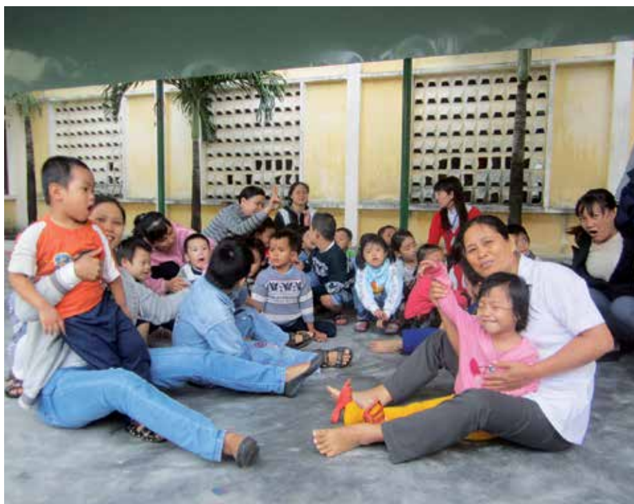
Kinderen en ouders tijdens de pauze, Phu Yen revalidatiecentrum

In MCNV's revalidatiecentrum in Phu Yen hebben veel kinderen door hun lichamelijke of geestelijke beperkingen nog extra problemen. Ze kunnen niet of nauwelijks goed praten en sommigen hebben problemen met slikken. Het is belangrijk om de spraak- en taalproblemen van deze kinderen zo jong mogelijk aan te pakken met logopedie. Ze hebben daar de rest van hun leven voordeel van!