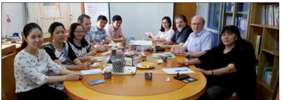
Delegatie Joris Ivens Stichting en Vietnamese Film Instituut te gast bij MCNV (Dong Ha, maart 2017)

Via dit magazine en de website houden we u op de hoogte van de plannen voor de viering van het 50-jarig bestaan van MCNV in 2018.