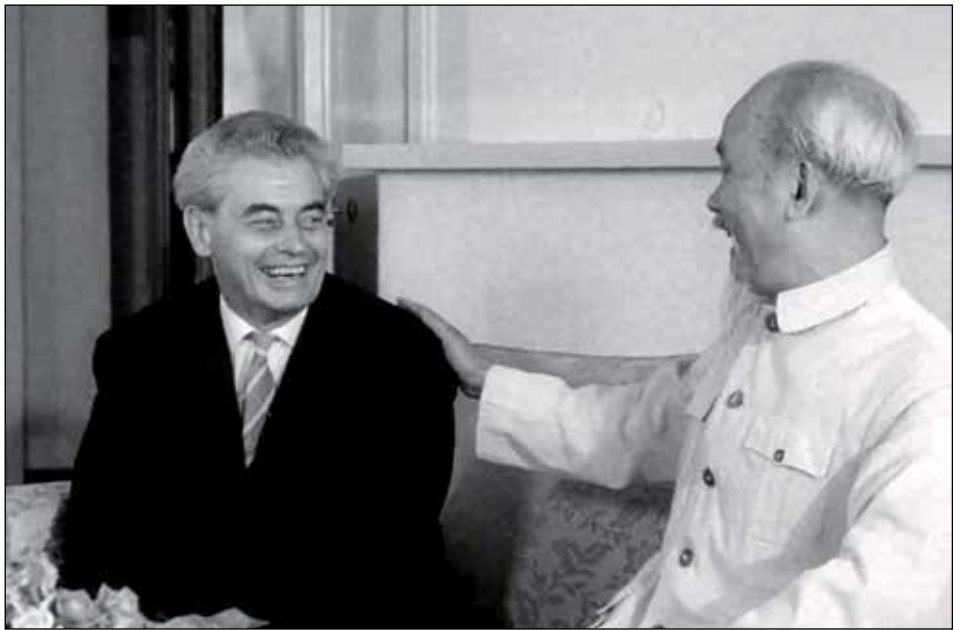
Joris Ivens in gesprek met president Ho Chi Minh uit de film Le ciel, la terre (1965)

In 2018 komen een aantal belangrijke wapenfeiten samen: 50 jaar MCNV, 45 jaar diplomatieke relaties tussen Nederland en Vietnam,