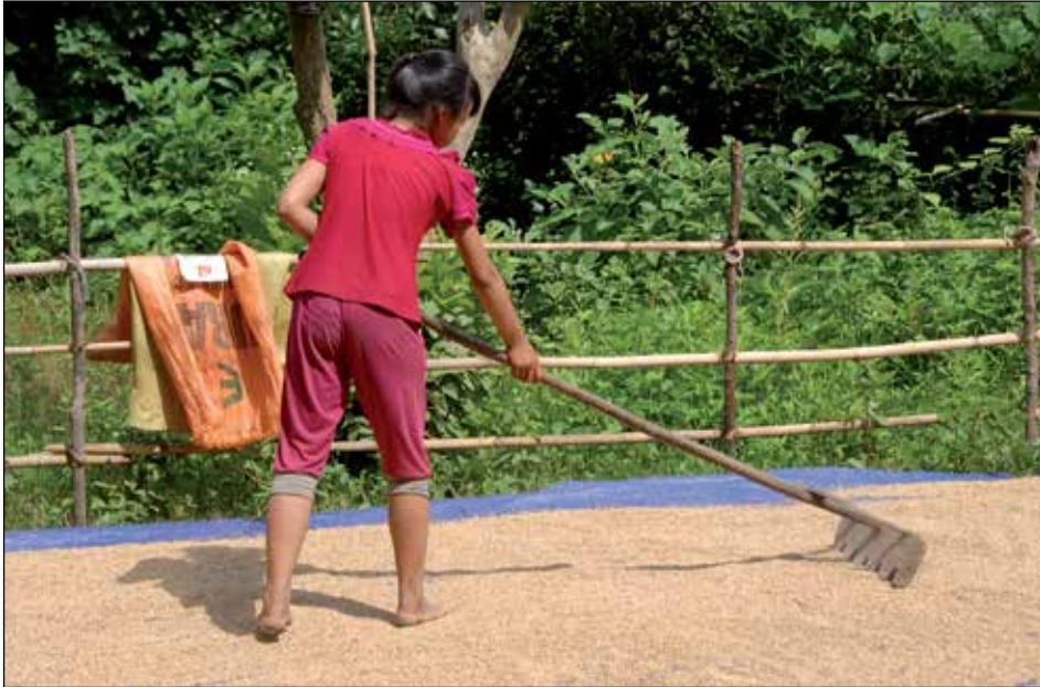
Vrouw aan het werk in Dien Bien