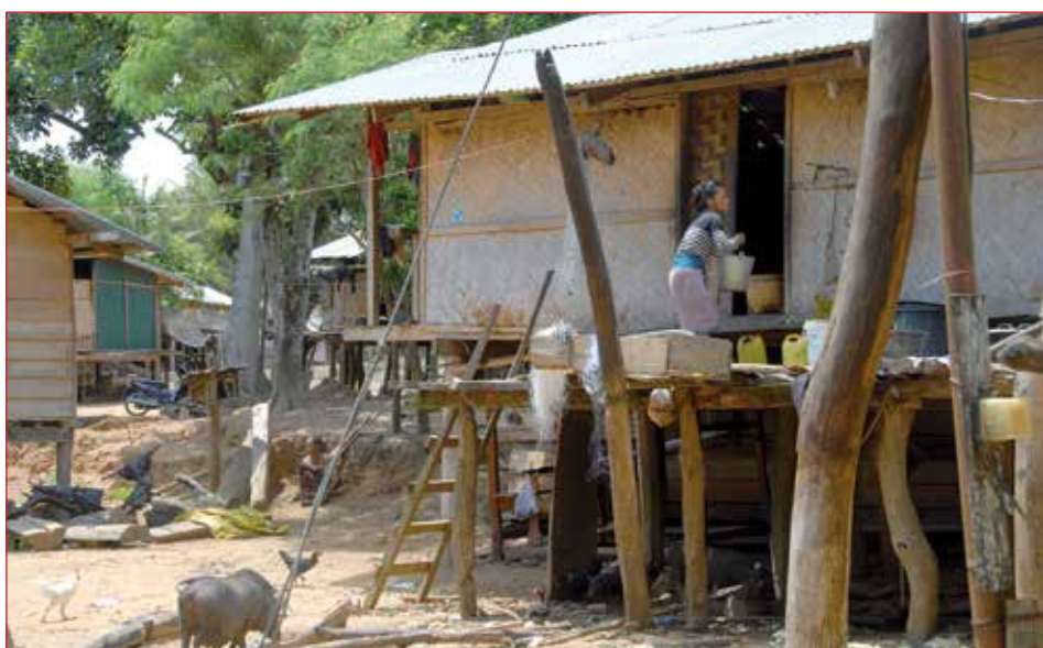
dorpsgezicht in Nong

Het is belangrijk dat we alle beschikbare middelen ten volle kunnen inzetten en overlapping van activiteiten kunnen voorkomen. Bounyom Noulasy, adjunct-gouverneur van het district Nong, benadrukte het belang van dit project “als extra ondersteuning voor het district, maar het is de rol en de verantwoordelijkheid van de lokale belanghebbenden om samen te werken bij het aanpakken van de voedselzekerheid en voedingsproblemen waarmee de kinderen en volwassenen in onze dorpen worden geconfronteerd.” ◀