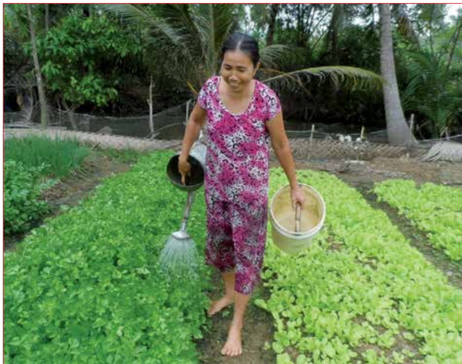
Deze vrouw gebruikte haar lening om te investeren in een groentetuin