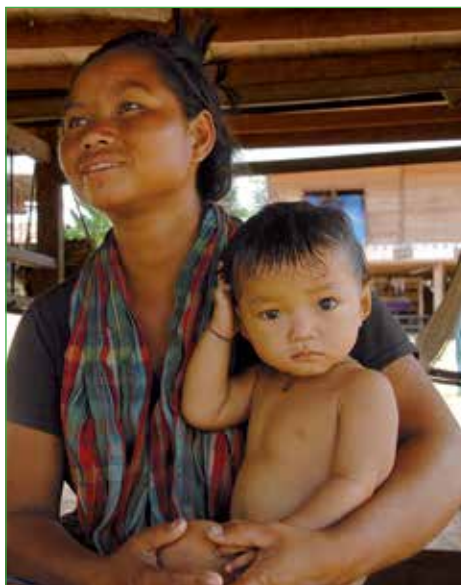
Moeder en kind in Nong, Savannakhet