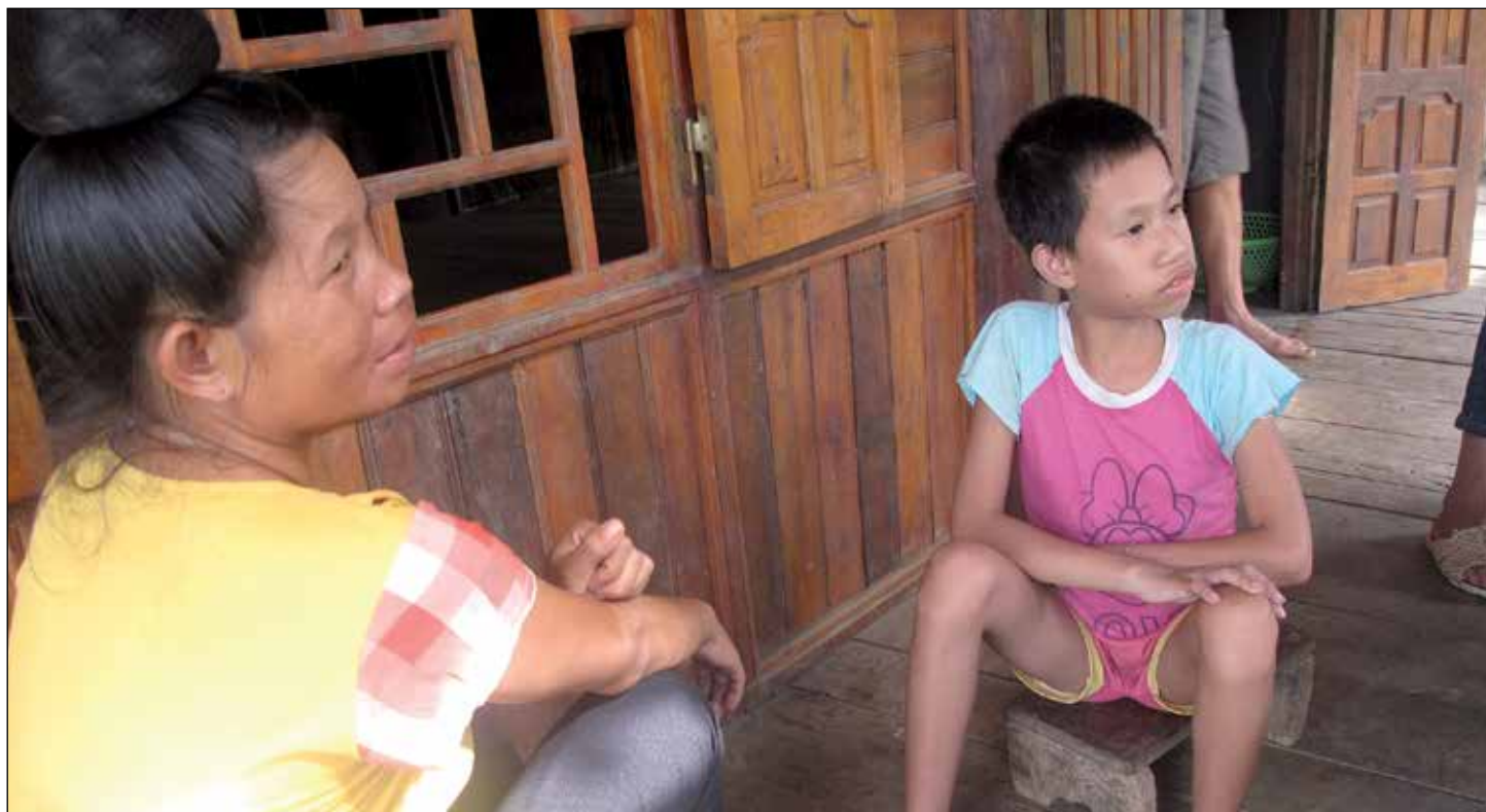
Hoa en haar oma

Hoa is een 9-jarig meisje dat bij haar oma woont in een plattelandsdorpje in een afgelegen streek in de provincie Dien Bien. Hoa had bij haar geboorte een hersenverlamming en is daardoor gehandicapt. Haar familie is extreem arm, haar ouders werken hard op het land, maar ze kunnen amper rondkomen. Toen Hoa 2 jaar oud was, lieten haar ouders haar in de steek omdat ze een handicap heeft. Sindsdien zorgt oma voor haar, terwijl haar broers en zussen bij hun vader en moeder wonen.