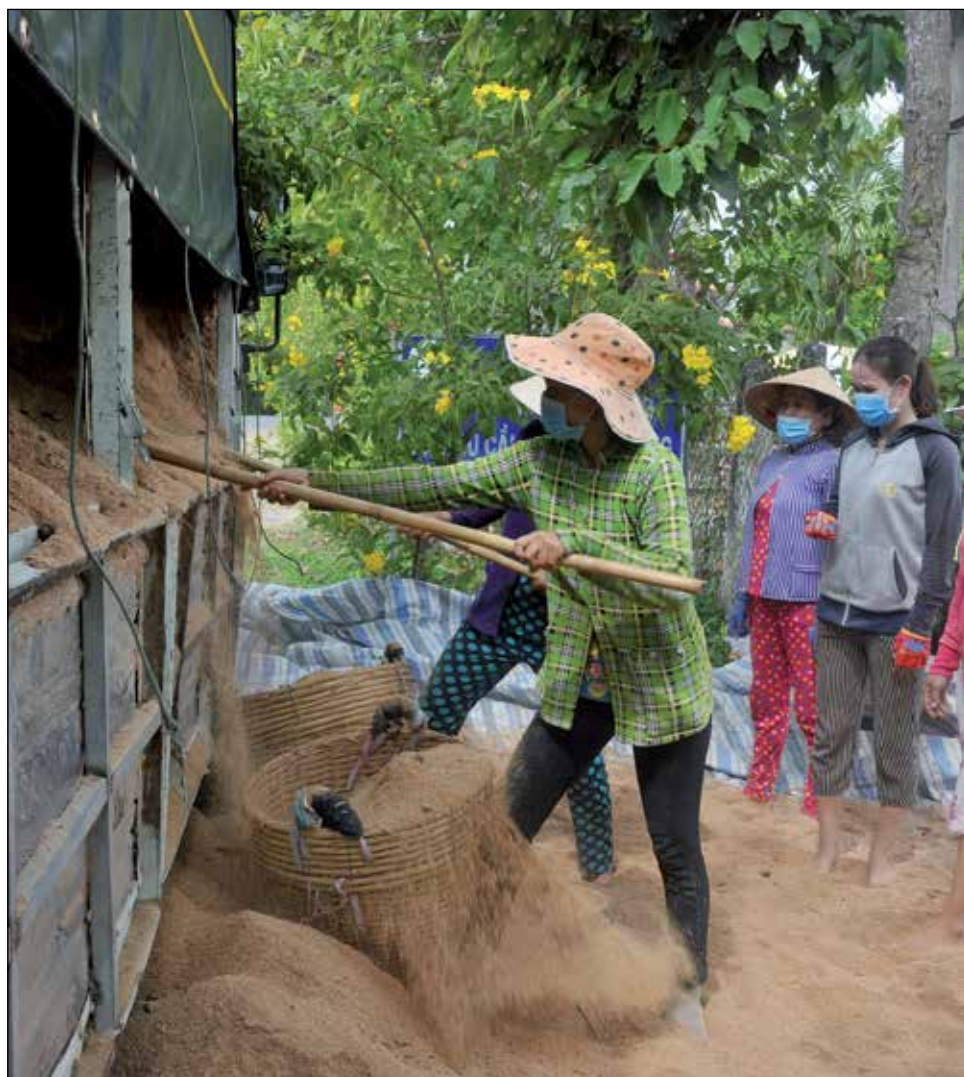
Deze vrouwen weten van aanpakken