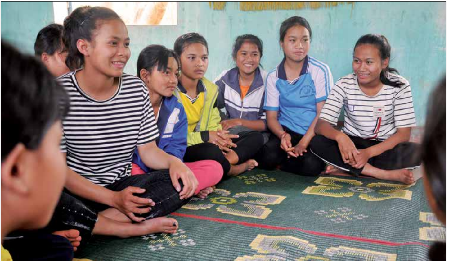
Tienermeisjes komen bij elkaar in het gemeenschapshuis

Gezond blijven, school afmaken, werk vinden. Als je 15 jaar bent en opgroeit in een afgelegen, arm dorp in Centraal Vietnam lijken sommige basisvoorwaarden voor een 'normaal' leven heel ver weg. MCVN begeleidt in Huong Hoa een project waarbij we verder kijken dan alleen de gezondheid van tienermeisjes. We proberen de meiden te stimuleren hun school af te maken en helpen ze ook op weg met een baan zodat ze beter in hun eigen levensonderhoud kunnen voorzien. Zo'n brede aanpak van de uitdagingen werkt goed, hebben we geleerd in Dien Bien, waar we eerder met groepen tieners werkten.