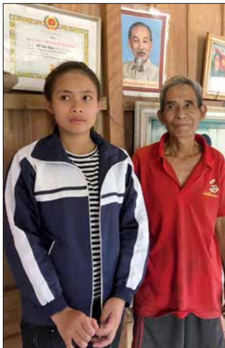
Chan en haar opa

Bij deze etnische stammen, de Bru-Van Kieu en Paco, begeleidt MCNV een project waarbij 1500 meisjes van 12 tot 19 jaar leren op eigen benen te staan. We leren ze niet alleen