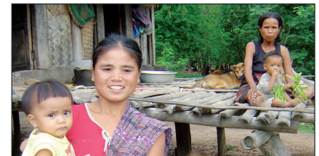
Juni 2025: Totaal bijeengebracht 16.450 euro Een gezonde start voor kinderen in Sepone en Phin, Laos