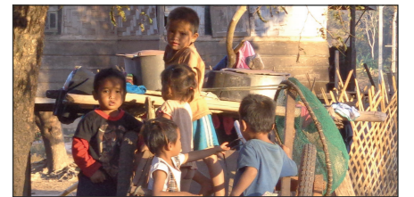
December 2025: Totaal bijeengebracht 17.000 euro (t/m eind februari 2026) Schoon water, toiletten en betere hygiëne in Phin en Sepone, Laos