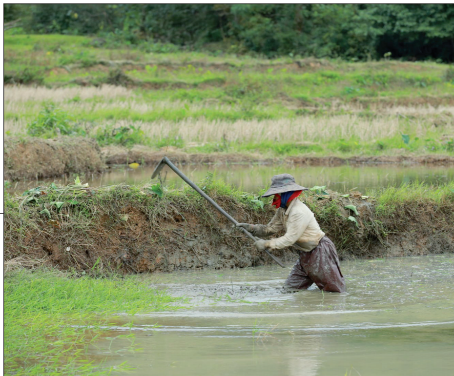
Ha aan het werk