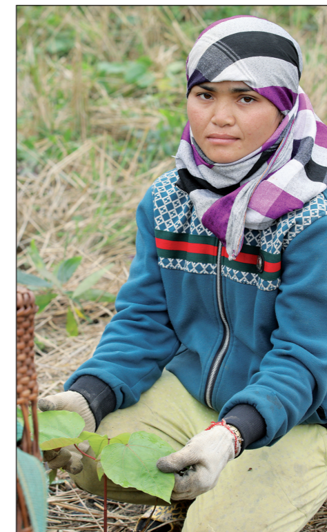
Ha op haar cassaveveld, zittend naast een kleine tungboom

Doel van het project is om vrouwen betere resultaten in landbouw- en veeteelt te laten behalen, door het combineren van traditionele