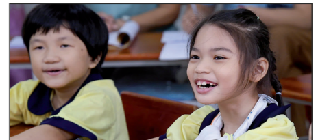
Maart 2025: totaal bijeengebracht 16.000 euro Gehandicapt, en toch naar school. Kinderen in de provincie Binh Dinh, Vietnam