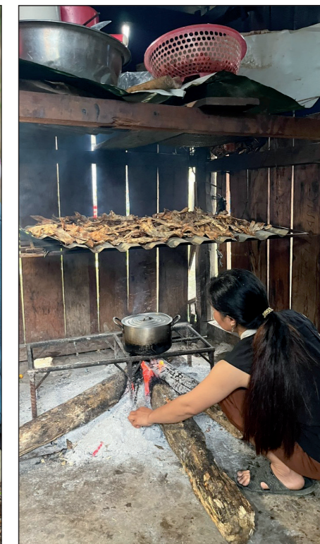
Ha kookt rijst voor haar kinderen

Het verbeteren van de voeding van vrouwen en kinderen is een centrale pijler van het programma. Via kleine, door vrouwen gerunde dorpswinkels krijgen gezinnen betere toegang tot veilig en voedzaam voedsel, terwijl lokaal ondernemerschap wordt versterkt. Zwangere vrouwen en moeders met jonge kinderen krijgen voedingsvoorlichting en ondersteuning om gezonde keuzes te maken, aangevuld met voedings-supplementen via lokale gezondheidsdiensten. Daarnaast werkt het programma samen met scholen om de kwaliteit van schoolmaaltijden voor jonge kinderen te verbeteren.