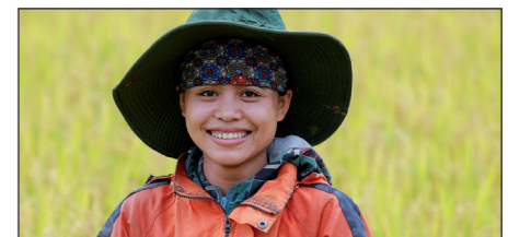
Oktober 2025: Totaal bijeengebracht 26.550 euro Inkomen verbeteren en banen voor boeren in Quang Tri, Vietnam