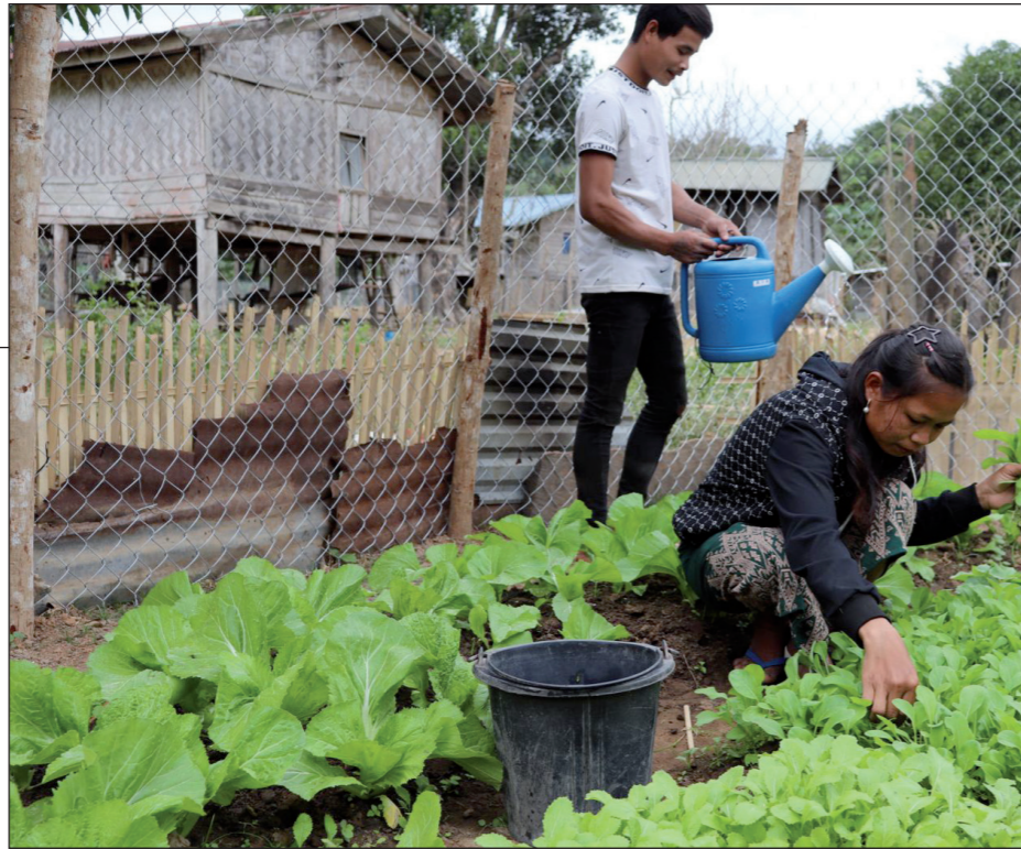
moestuin met een metalen hek