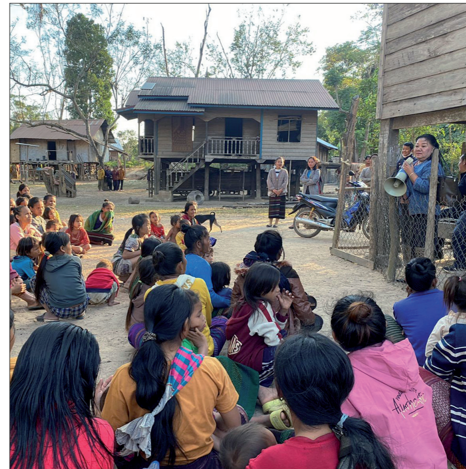
voorlichting over voeding in Sepone